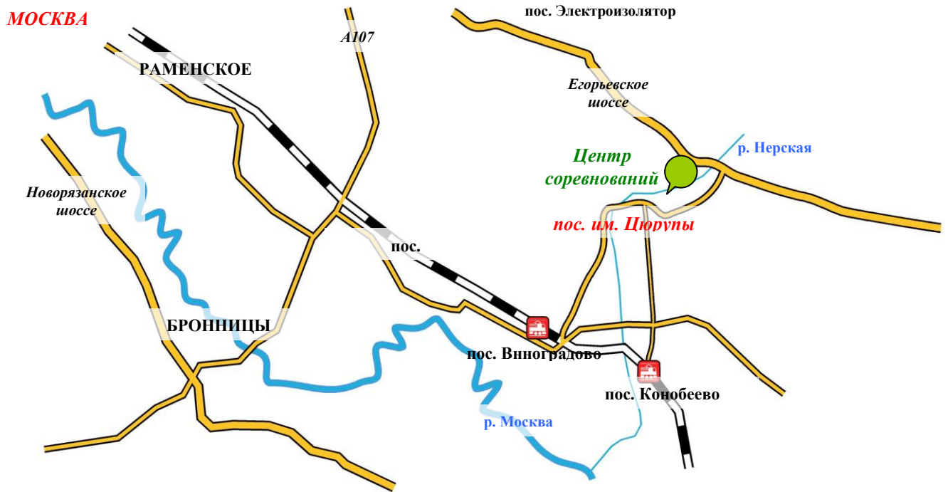
Схема проезда от г. Москва до центра соревнований